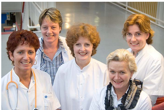
Projectteam Prospectieve Risico-analyse

Intern is een belangrijke verandering in 2006 geweest de invoering van het Meerkeuzesysteem als extra arbeidsvoorwaarde. Dit houdt in dat medewerkers zelf een stem hebben in de samenstelling van hun arbeidsvoorwaardepakket. De een hecht nu eenmaal meer aan vakantiedagen en de ander aan korting op de aanschafprijs van een fiets.